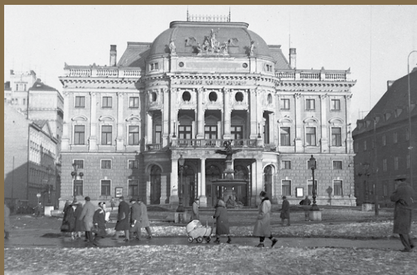
Historická budova SND, rok 1960

Na líci zberateľskej euromince je vyobrazená historická budova Slovenského národného divadla. V spodnej časti mincového poľa je štátny znak Slovenskej republiky, ktorý je kompozične vsadený doprostred letopočtu 2020. Názov štátu SLOVENSKO je v opise pri hornom okraji zberateľskej euromince. Vľavo od letopočtu je značka Mincovne Kremnica, štátny podnik, ktorú tvorí skratka MK umiestnená medzi dvoma razidlami. Vpravo od letopočtu sú štylizované iniciálky autora zberateľskej euromince Mgr. art. Petra Valacha PV.