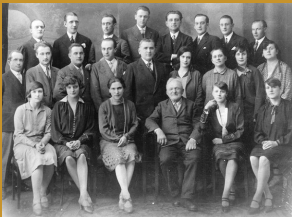
Súbor Činohry SND, rok 1925