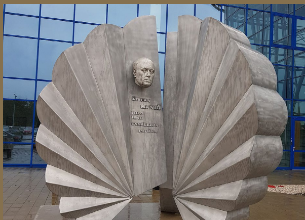
Pamätník Štefana Baniča na Letisku M. R. Štefánika v Bratislave

Na líci zberateľskej euromince je vyobrazený ná-kres padáka zostrojeného Štefanom Baničom z dobovej patentovej listiny. V ľavej časti mincového poľa je štátny znak Slovenskej republiky. Pri spodnom okraji zberateľskej euromince vľavo je v opise letopočet 2020 a vpravo je v opise názov štátu SLOVENSKO. Pod vyobrazením padáka je značka Mincovne Kremnica, štátny podnik, ktorú tvorí skratka MK umiestnená medzi dvoma razidlami, a pod ňou sú štylizované iniciálky autora zberateľskej euromince Mgr. art. Petra Valacha PV.